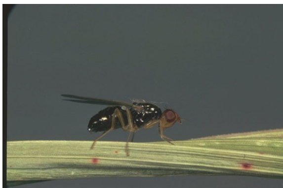
Mouche au repos