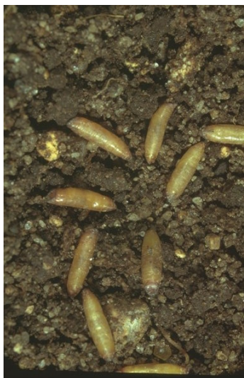
Pupes sur le sol