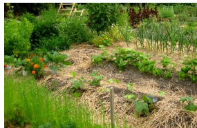
Jardin écologique naturel