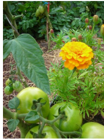
Plantes auxiliaires : œillet d'Inde ou tagète avec tomates.

RESULTAT : Les déjections des vers de terre et les matières produites par la microfaune du sol donnent un humus stable capable de fixer les ions(éléments) solubles par des liaisons que seules les forces d'absorption des radicelles des plantes peuvent détacher.