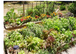
Jardin de cultures associées